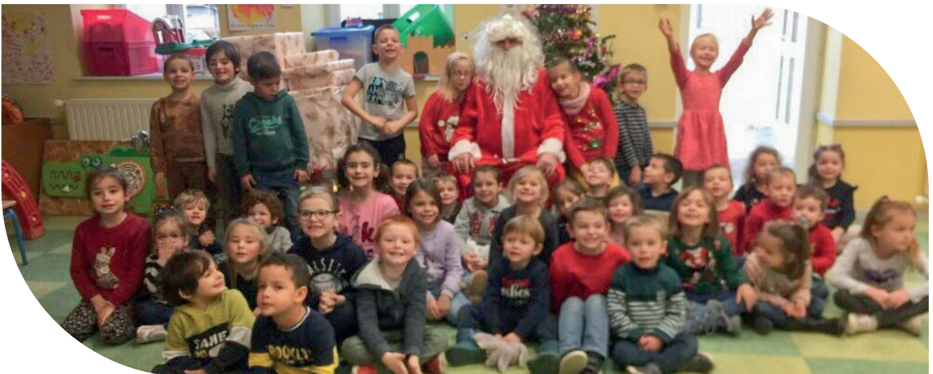
Des enfants sages et souriants autour du père Noël