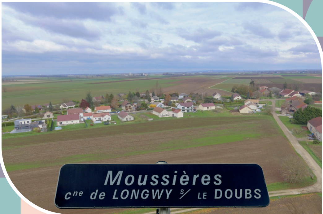
Moussières c ne de LONGWY / LE DOUBS