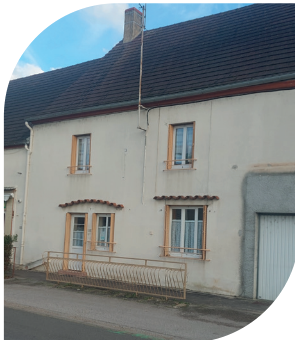
LE LOUP QUI DORT