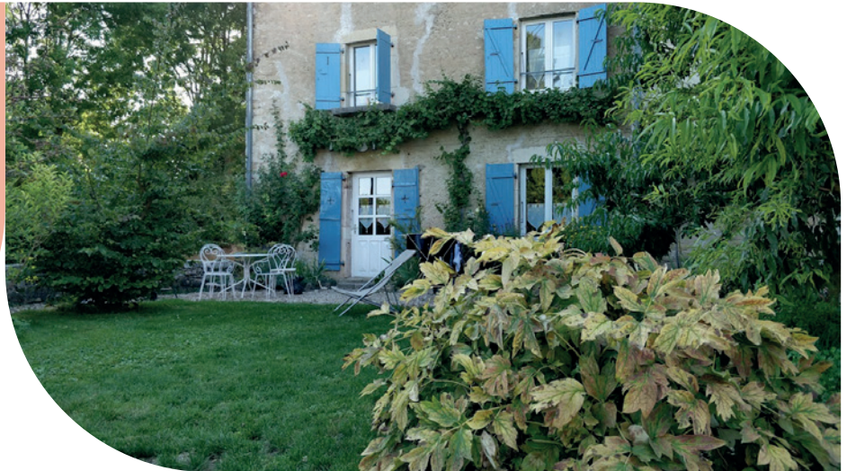
LE CHAT PERCHÉ