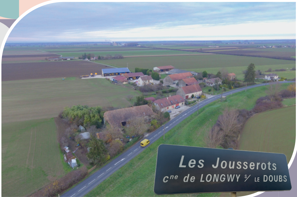
Les Jousserots c ne de LONGWY / LE DOUBS